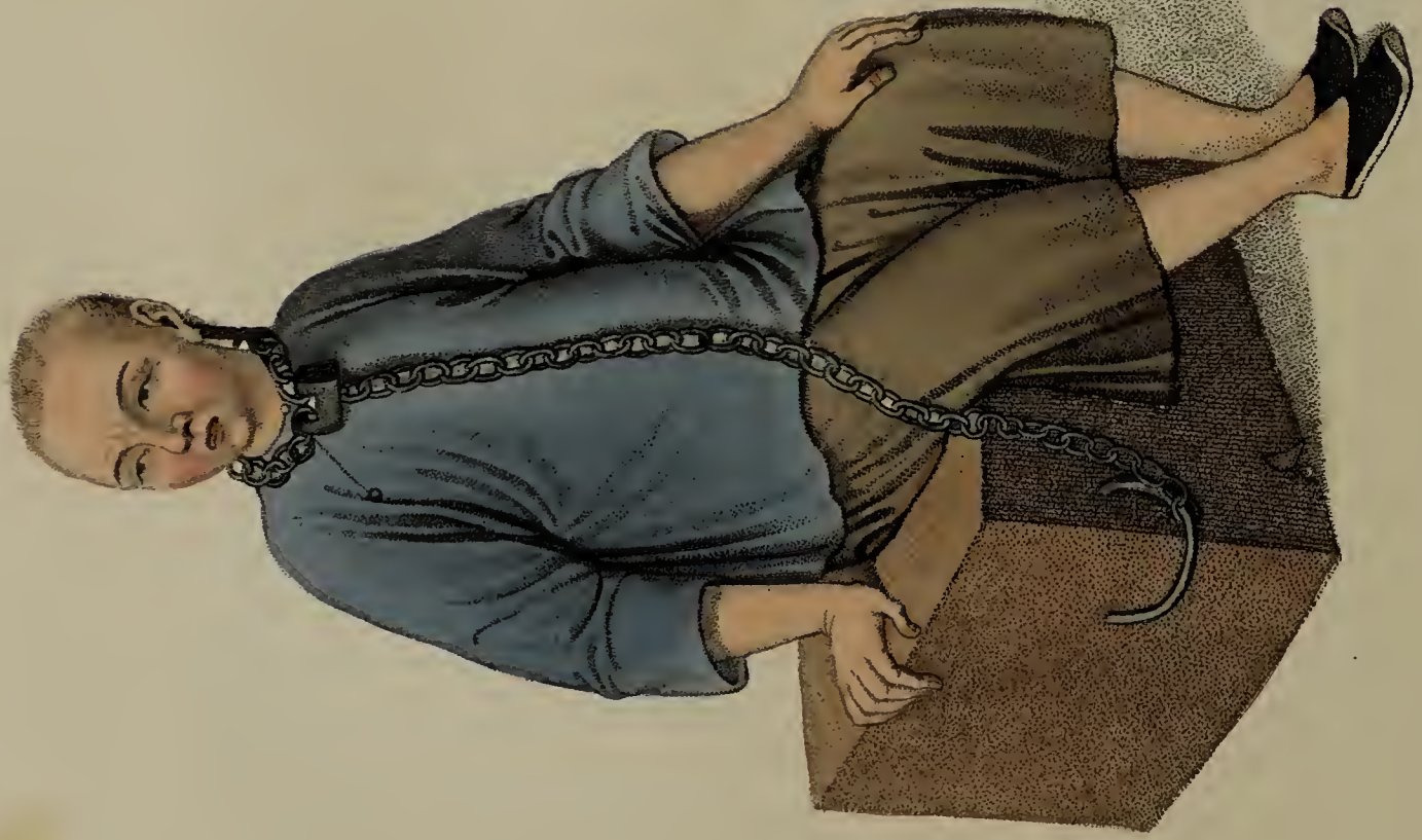
Engraved by Dudley: for W. Miller. Old Bond St. London. Jan. 8. 1861.