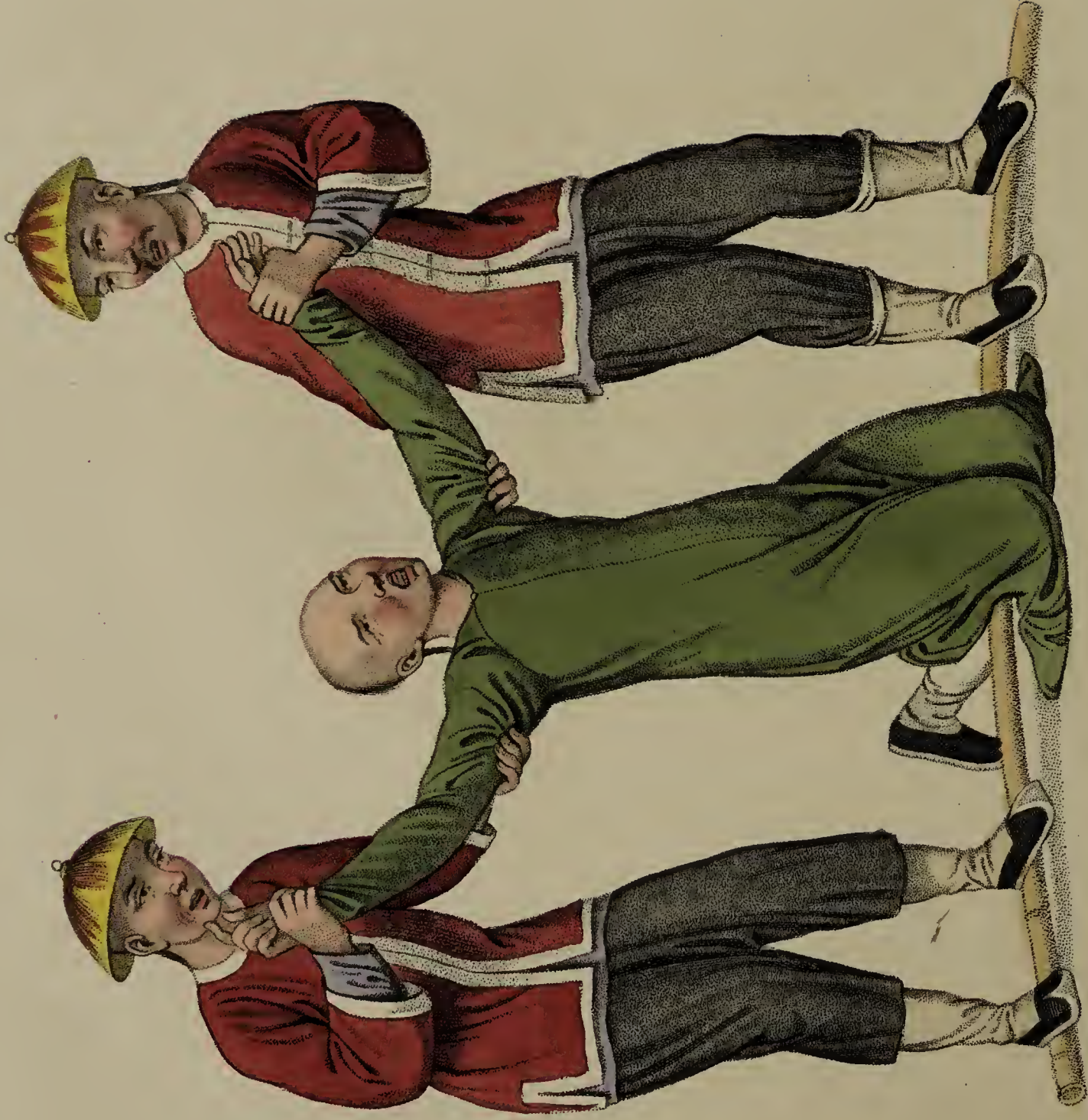
Engraved by Dadley, for W. Miller, Old Bond Str. London, Jan. 2. 1861.