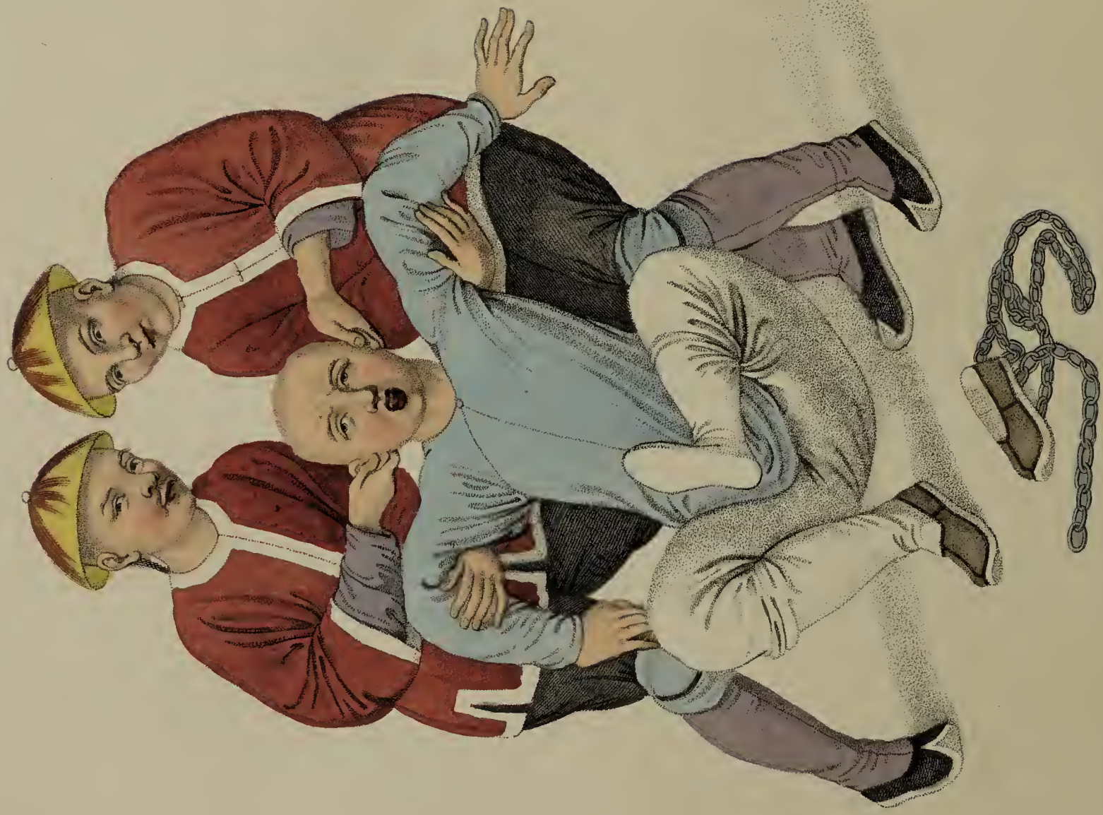
Engraved by Dudley, for W. Miller, Old Bond Str. London, Jan 2 1861.