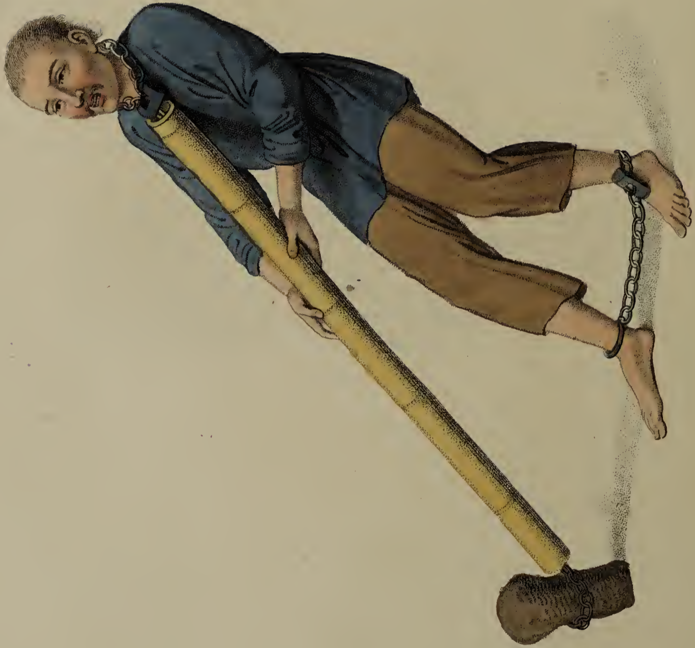
Engraved by Dudley, for W. Miller, Old Bond Str, London, Jan. 1801.