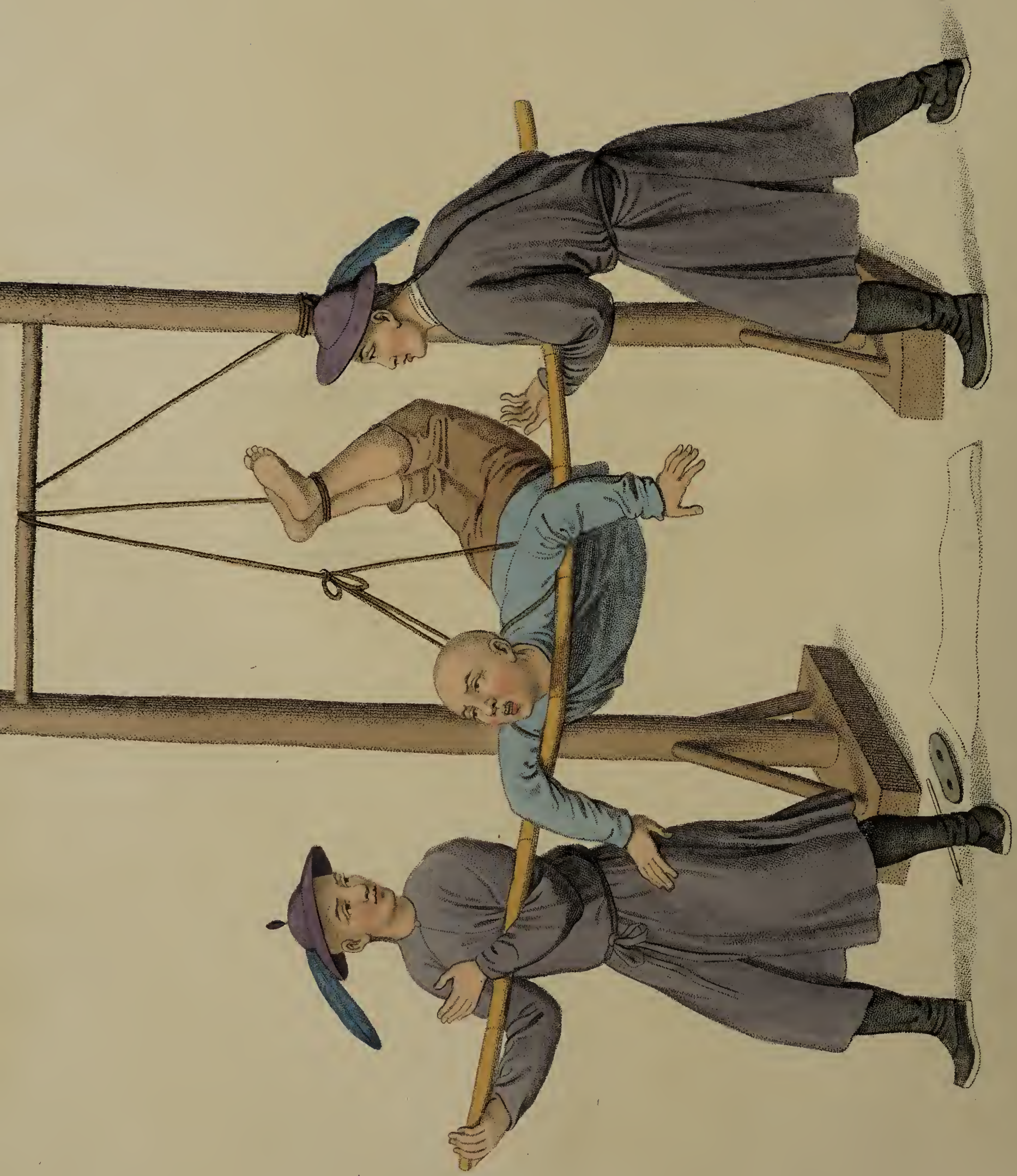
Engraved by D. Adley for W. Miller, Old Bond St. London, Jan. 1. 1801.