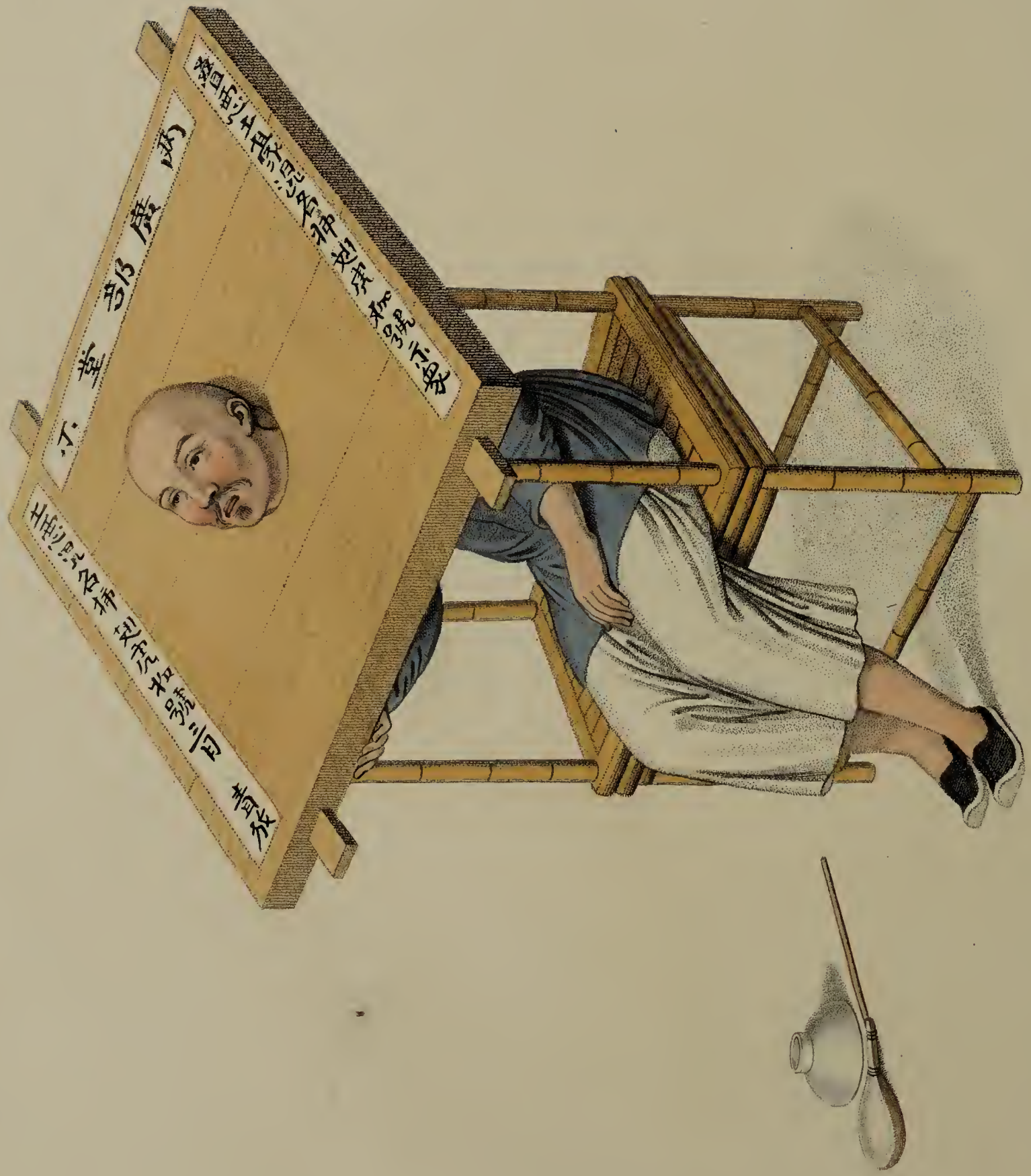
Engraved by Dally, for W. Miller, Old Bond St. London, Jan. 1. 1861.