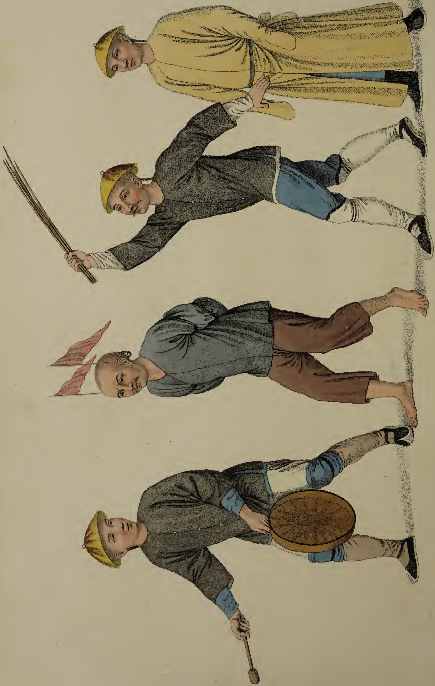
Engraved by Dudley, for W. Miller, Old Bond Str., London, Jan. 1 1841.