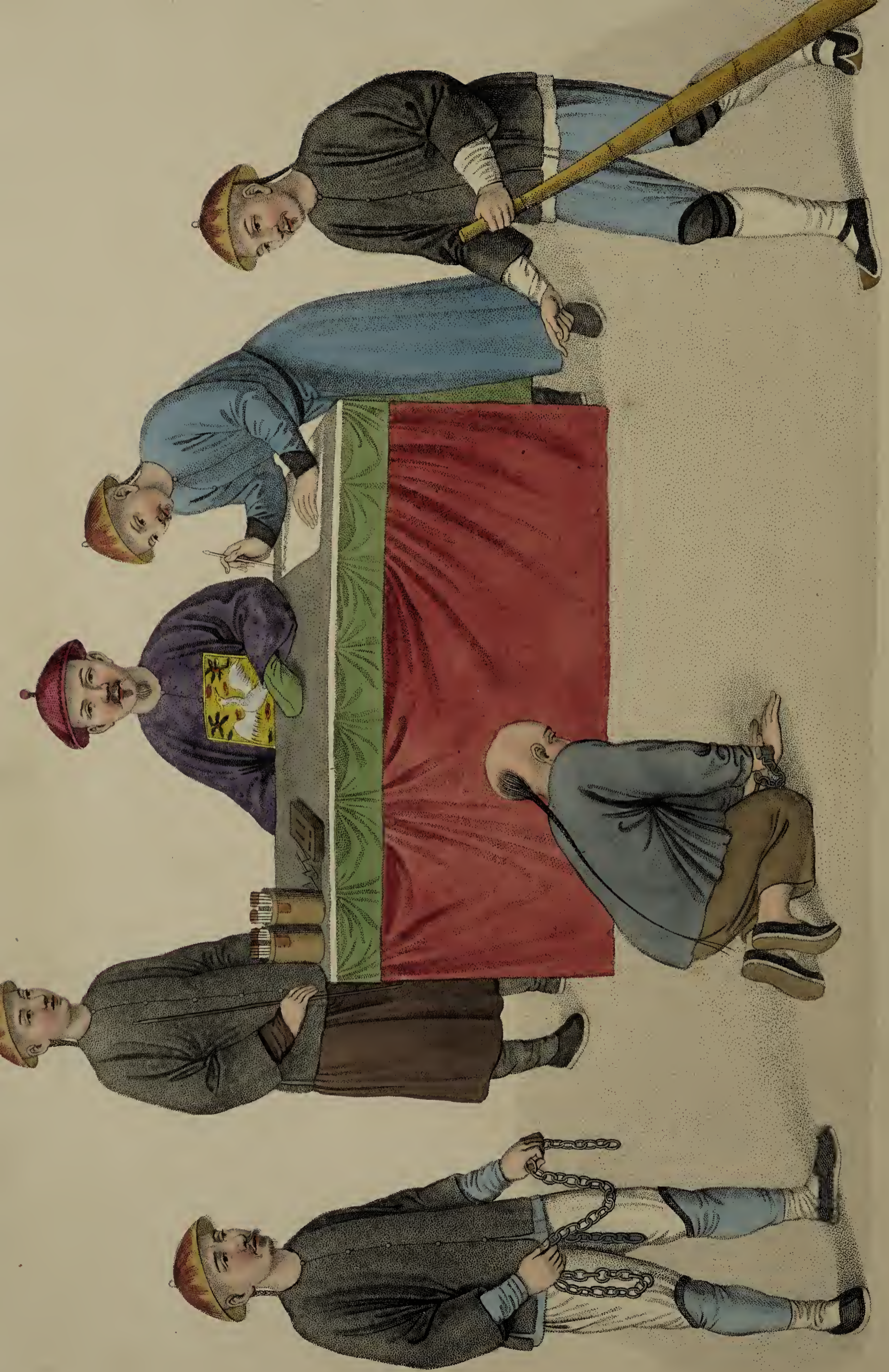
Figure 1 by Dudley, for W. Miller, of Bond St. London, Jan. 1841.