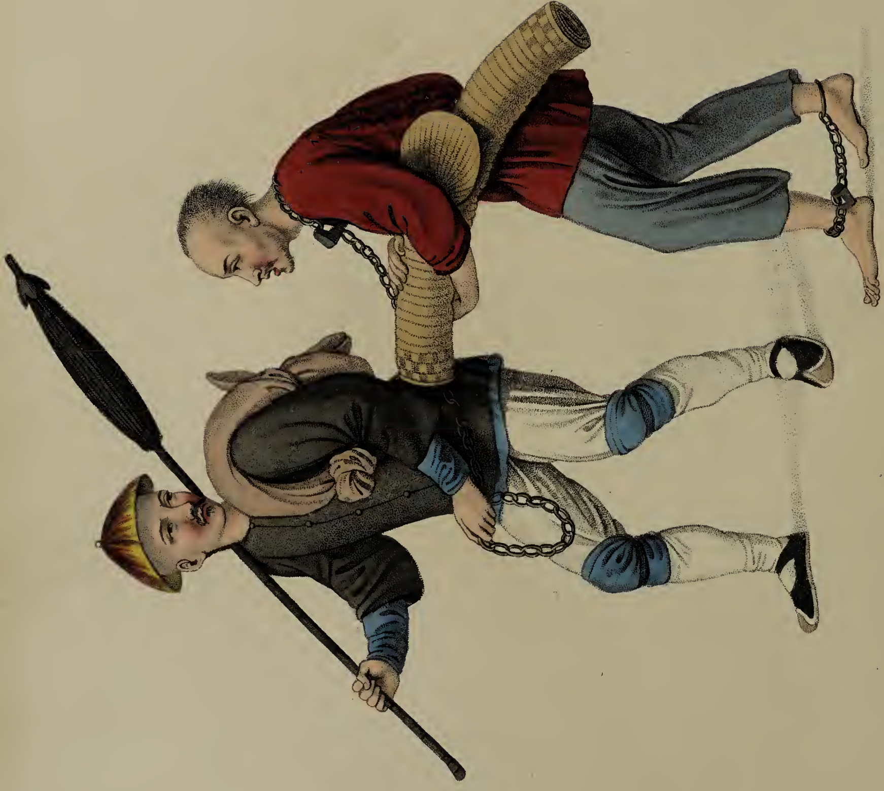
Engraved by Underley, for W. Miller, Old Bond St. London, Jan. 1. 1861.