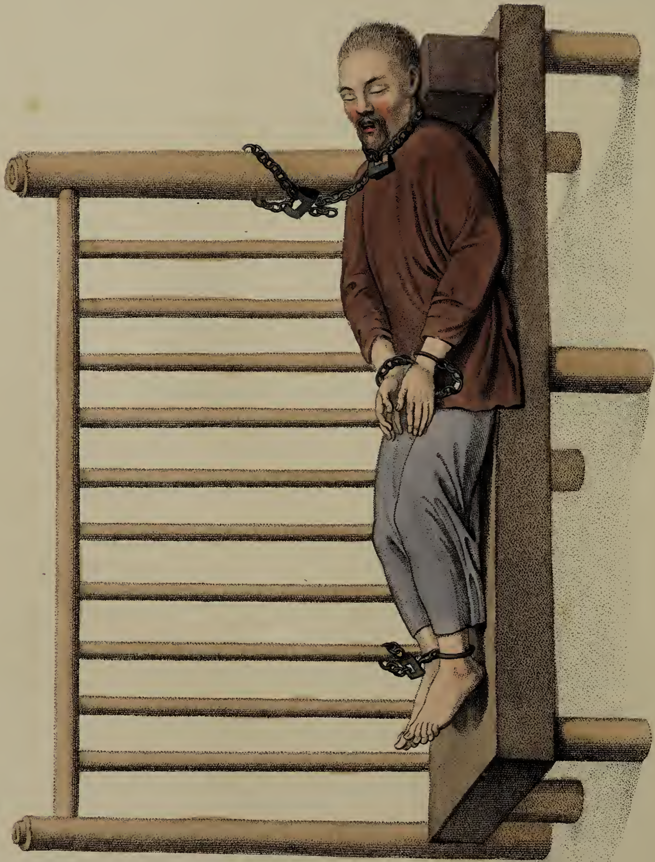
Engraved by (Dadley for W. Miller, Old Bond S. London, Jan 7. 1861.