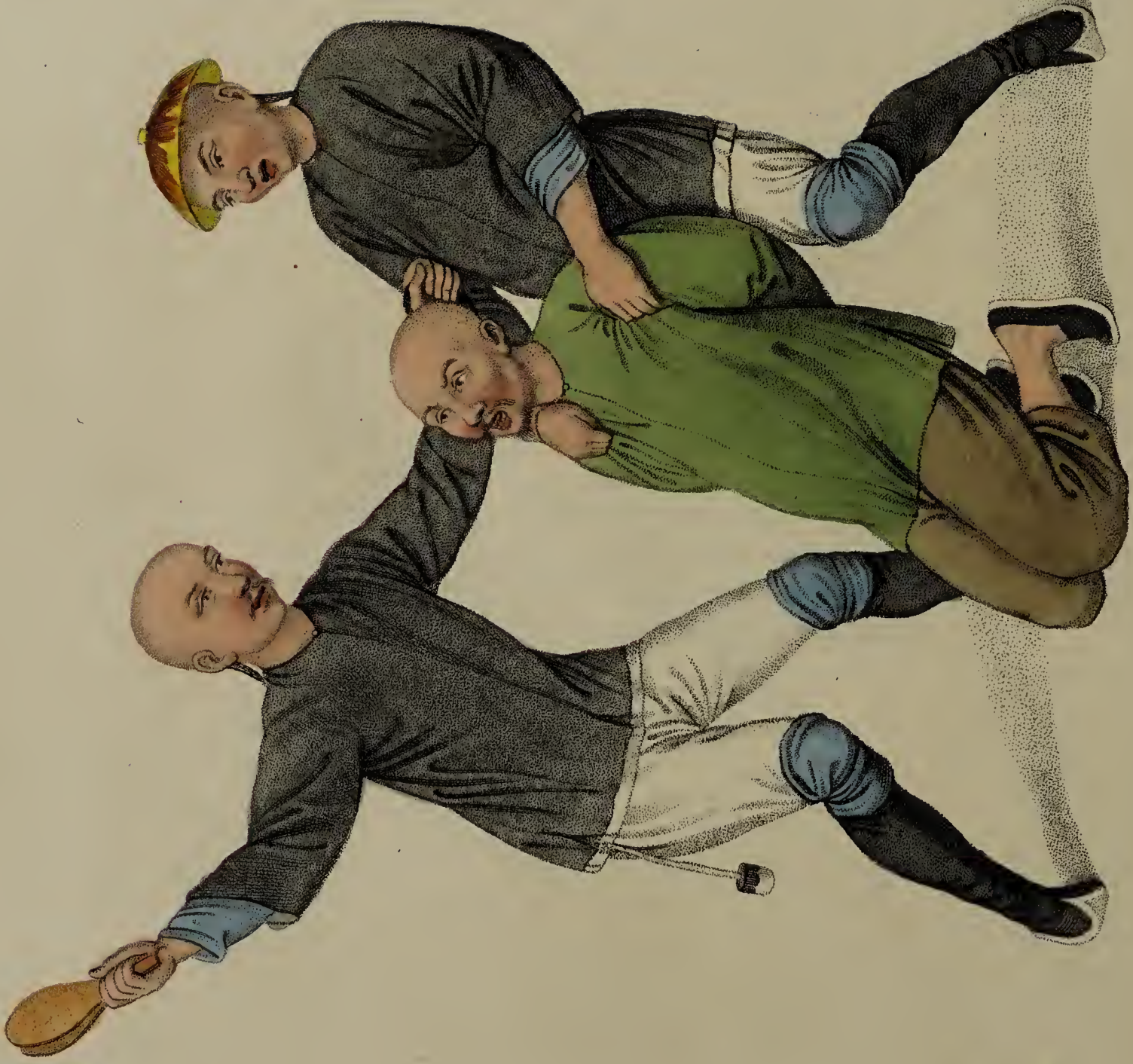
Engraved by Dudley, for W. Miller, Old Bond Str., London, Jan. 1. 1841.