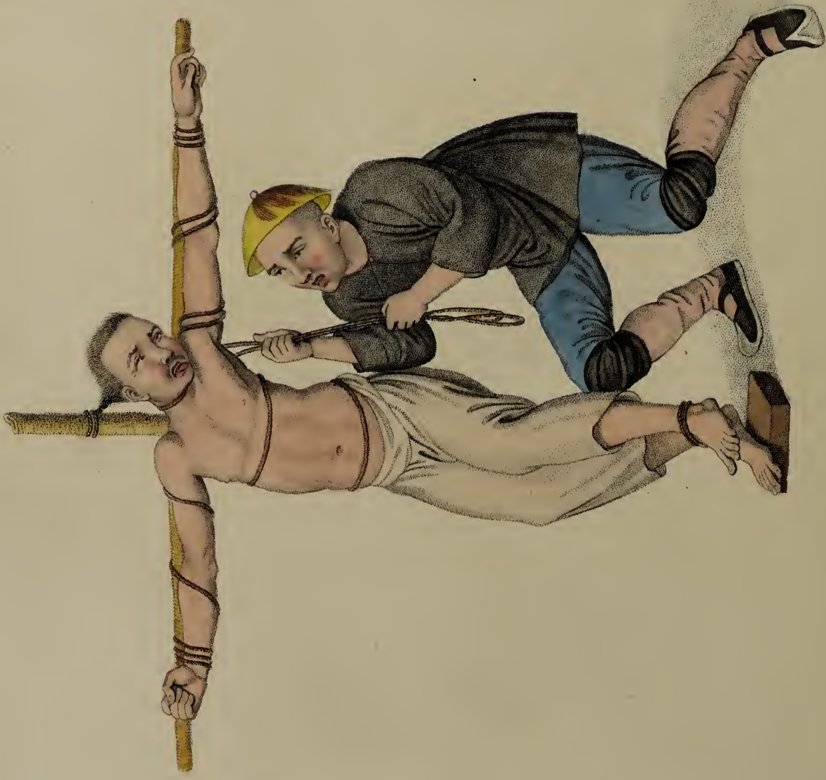
Engraved by Dudley for W. Muller, Old Bond Str. London. Jan. 11. 501.