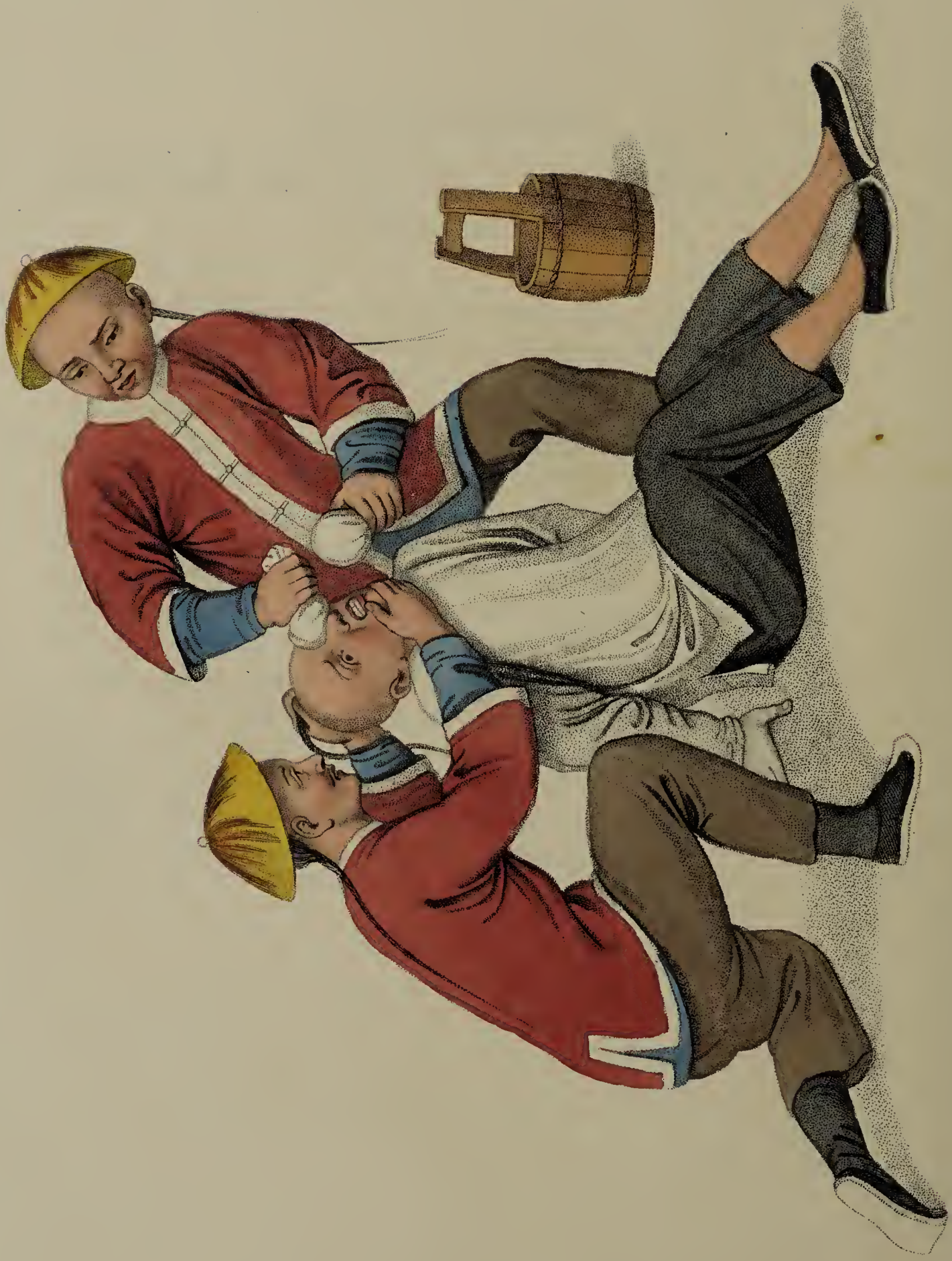
Engraved by 'Dadley for W. Miller, Old Bond Str., London, Jan. 1. 1861.