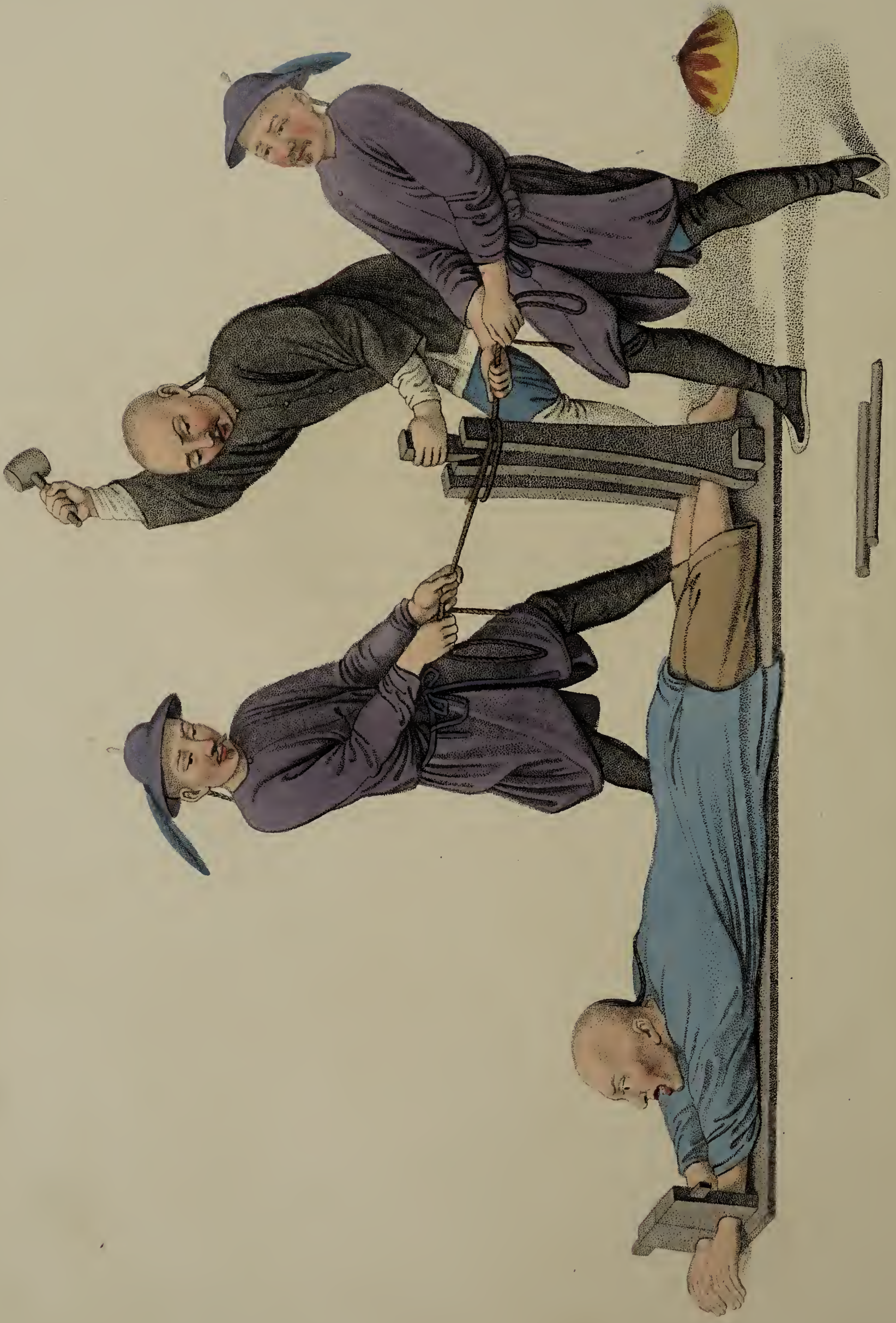
Engraved by Coadley for W. Miller, Old Bond Street, London, Jan. 1, 1861.